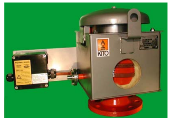
Beispiel : KITO VD/KS m. Klapphaube

(Baumaße bei Ausführung mit elt. Beheizung können von Originalmaßen abweichen)