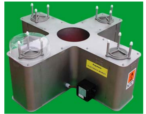
Beispiel : KITO DS/M (KITO BEH/M)