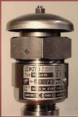
Unterdruckventil KITO VS/cont