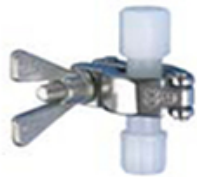
Tri-Clamp Verschraubungen 3C