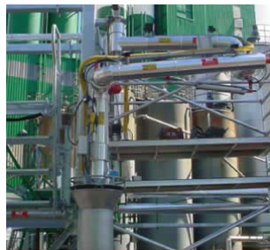
Elektrisch beheizter Oberverladearm