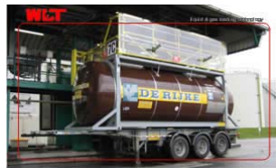
Pneumatische Absturzsicherung mit Wetterschutz