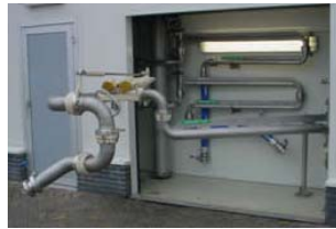
Bodenverladearm im verschließbaren Schutzraum montiert