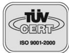
Certified Quality System First Certified in 1992