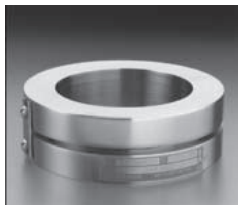
C.D.C.'s Insert Type Holder